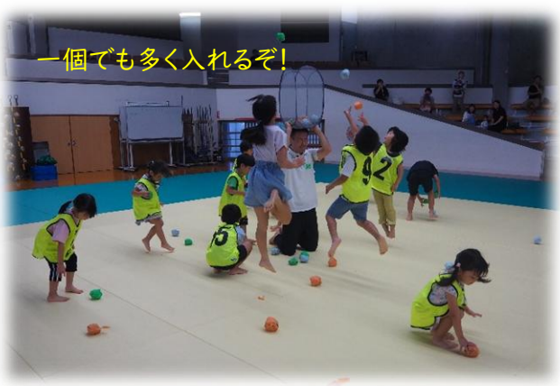
一個でも多く入れるぞ!