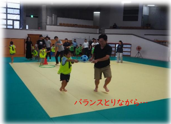
バランスとりながら...