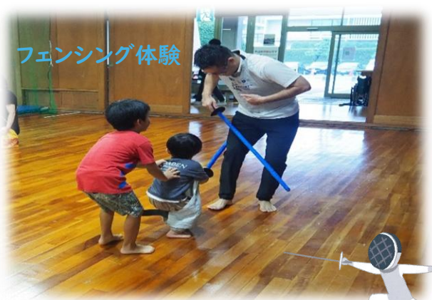
フェンシング体験